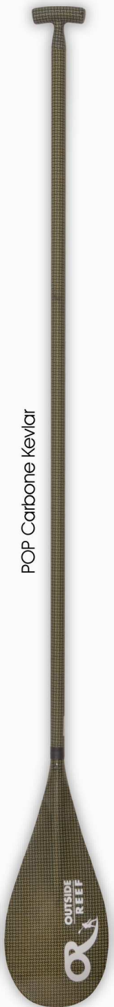
POP Carbone Kevlar