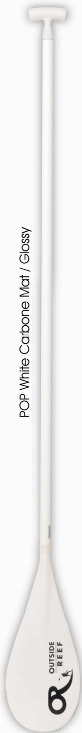
POP White Carbone Mat / Glossy