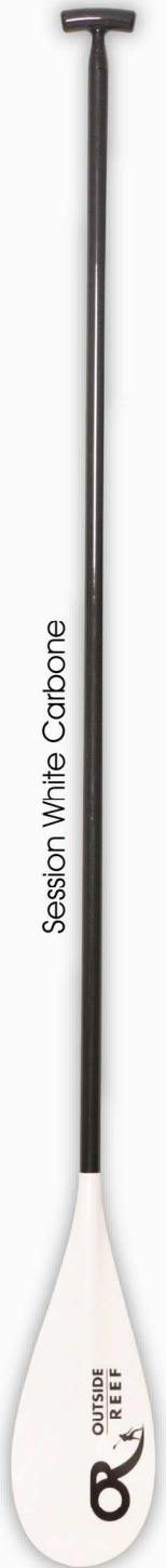
Session White Carbone