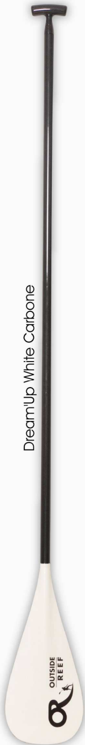
Dream'Up White Carbone